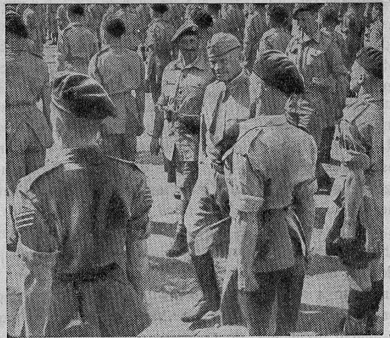
El bizarro Gral. Woesinower, Comandante en Jefe de los Aliados, en el Mediterráneo, vencedor del Norte de Africa, Sicilia e Italia revistando tropas