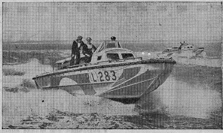
En estos botes van los marinos ingleses explorando los mares en busca del enemigo de la humanidad.

Esperamos que esta nuestra moción encontrará eco en las autoridades llamadas a estudiarla.