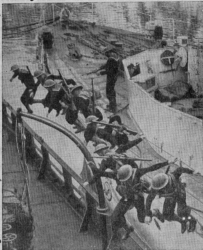
Los valerosos canadienses en prácticas de desembarco

En la guerra relámpago de 1940-41 los alemanes dejaron caer un total de 35.000 toneladas de bombas sobre las ciudades inglesas.