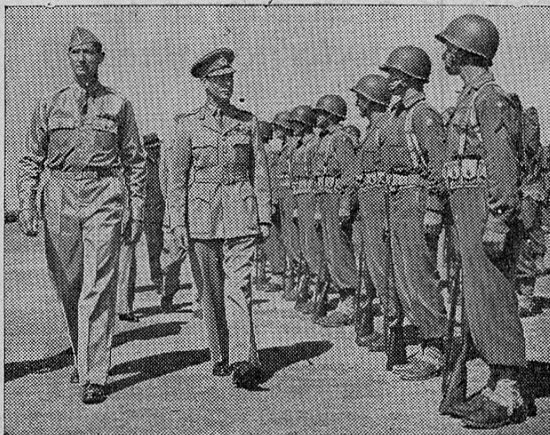
El Rey Jorge VI y el General Clark, revistando tropas en Africa del Norte